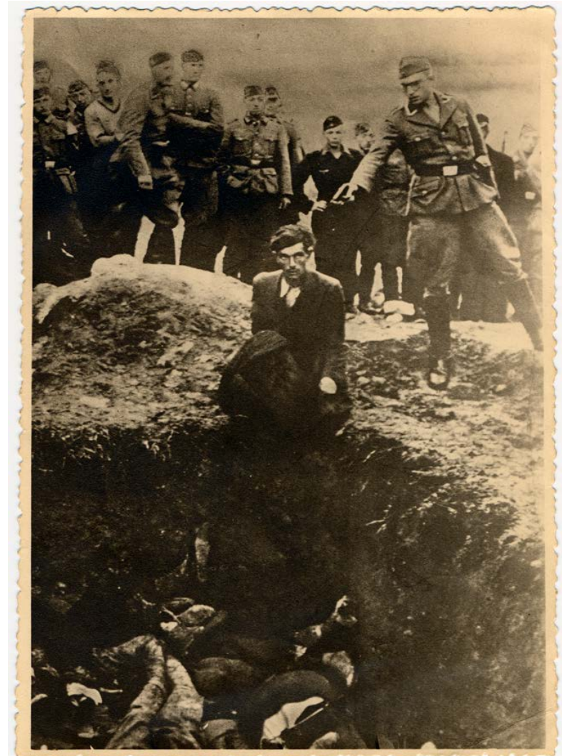
Medlem af nazistisk einsatz-gruppe skyder ukrainsk jøde, Vinnitsa, Sovietunionen, 1942